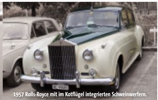
1957 Rolls-Royce mit im Kotflügel integrierten Scheinwerfern.