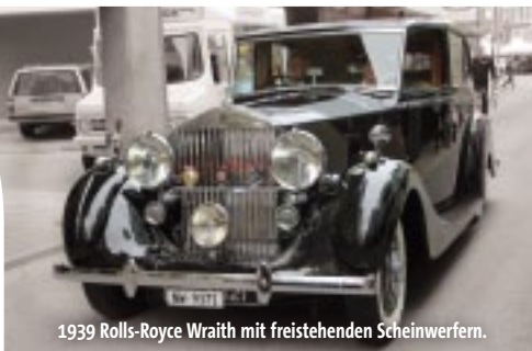
1939 Rolls-Royce Wraith mit freistehenden Scheinwerfern.