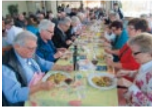
Beste Erinnerungen an die MV von 2012. Alle Bilder siehe: www.SMVC.ch [über uns] [Bildergalerie] [Bilder und Links 2012] nach unten scrollen.