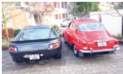
Links: 1980 Porsche 928S mit integriertem Stossfänger; rechts: 1975 Saab 96 mit Chromstossstange.